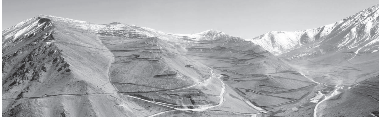
カセロネス銅・モリブデン鉱山(チリ)

私たちは、 資源開発から生産・販売まで一貫して行う、 世界トップクラスの非鉄金属メーカーです。