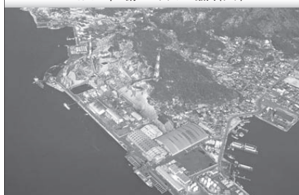
日比共同製錬(株)玉野製錬所