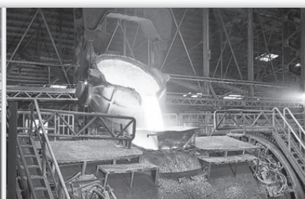
精製炉(佐賀製錬所)